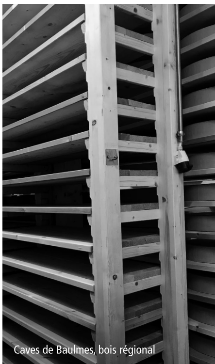
Caves de Baulmes, bois régional

La société de Baulmes a inauguré ses nouvelles caves à Gruyère le 4 octobre 2019. Après plus de six ans de procédure, elle a pu étendre son activité sur un terrain adjacent. La cave est reliée par un tunnel à la fromagerie.